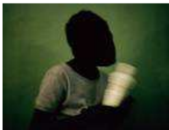
L'ombre de l'enfance