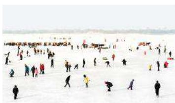
Conte d'hiver, conte d'été