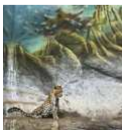
In Situ - Etats-Unis