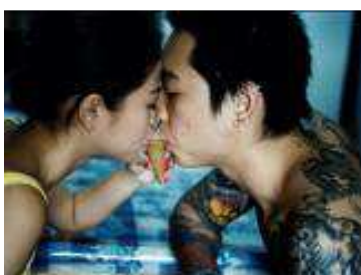
Les classes moyennes à Singapour, Kuala Lumpur et Bangkok