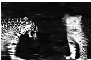
anima © Jean-François Spricigo, 2009