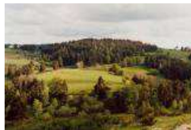
Campagne française, fragments