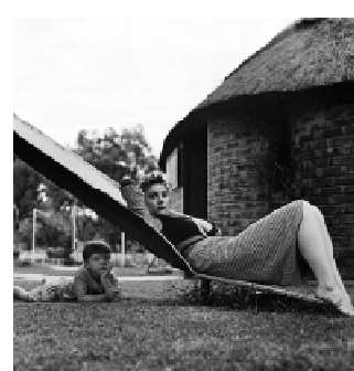
Les Blancs Africains, voyage au pays natal